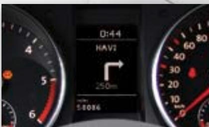
Anbindung an die Multifunktionsanzeige Plus (MFA+)

Mittels dieser Technik verbessert sich die Ablesbarkeit des Displays bei direkter Sonneneinstrahlung deutlich. Eine antireflektive Beschichtung des Touchscreens sowie die vollflächige feste Verbindung (Laminierung) von Touchscreen und Display verhindern interne Reflexionen und Lichtbrechungen. Das Display gewinnt an Kontrast und Schärfe.