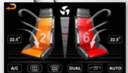
Anzeige Klimaanlage, Sitzheizung