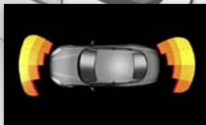
Anzeige der Parksensoren (OPS)